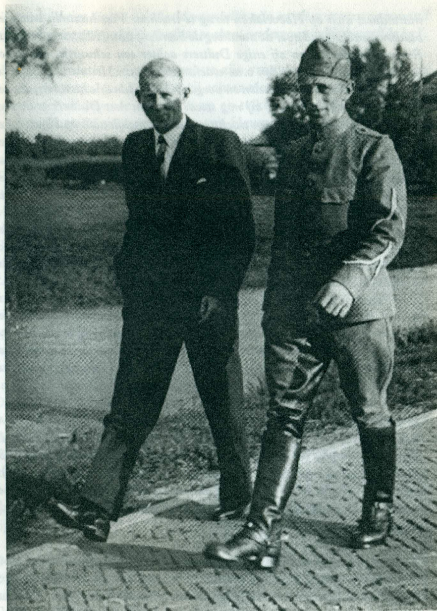
Een foto uit de mobilisatietijd nog tijdens zijn fourierschap. Dit is te zien aan de strepen op de mouw even boven de elleboog. Genomen op zondagmorgen op de weg naar de kerk.

Niet lang daarna echter moest de 6e Veldartillerie zich terugtrekken tot achter het valleikanaal en stonden de huzaren van het 1e Regiment alleen tegenover een geweldige overmacht aan Duitse troepen en materieel. De Duitse troepen maakten omtrekkende bewegingen om zo de tegenstand te kunnen breken. Tijdens deze gevechten in de kern van Achterveld vielen doden, waaronder ook de bevelhebbers van het 4e Eskadron. Van bevelvoering verstoken en onder zware druk van de Duitse overmacht probeerden de huzaren aan omsingeling gevangenneming te ontsnappen en